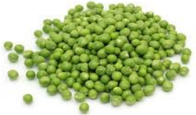
പട്ടാണി കടല वर्तुलम्